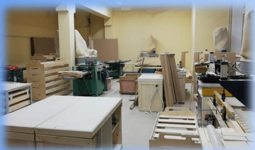
РЕСУРСНЫЙ ЦЕНТР ДЕРЕВООБРАБОТКИ