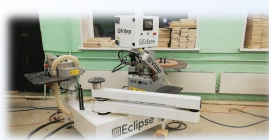
КРИВОЛИНЕЙНО- КРОМОЧНЫЙ СТАНОК С ЧПУ