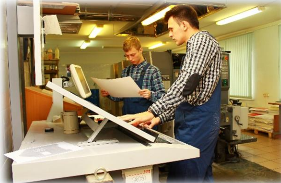
ТИПОГРАФИЯ ОФСЕТНОЙ ПЕЧАТИ