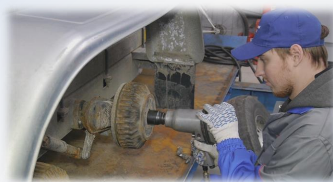
ООО МОСКОВСКИЙ ЗАВОД СПЕЦИАЛИЗИРОВАННЫХ АВТОМОБИЛЕЙ