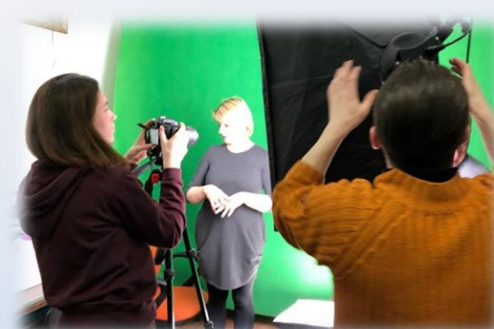
ВСЕРОССИЙСКОЕ ТЕЛЕВИДЕНИЕ ГЛУХИХ