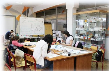
ГРАФИКА И КУЛЬТУРА ЭКСПОЗИЦИИ