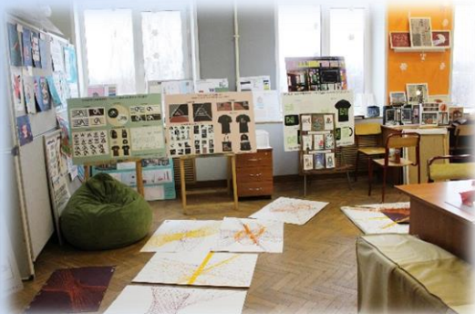
МАКЕТИРОВАНИЕ ГРАФИЧЕСКИХ РАБОТ