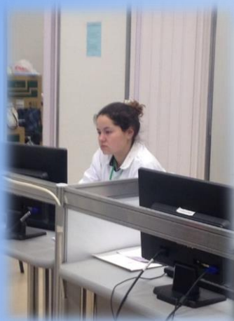
АО «ЭЛЕКТРОННЫЙ АРХИВ»