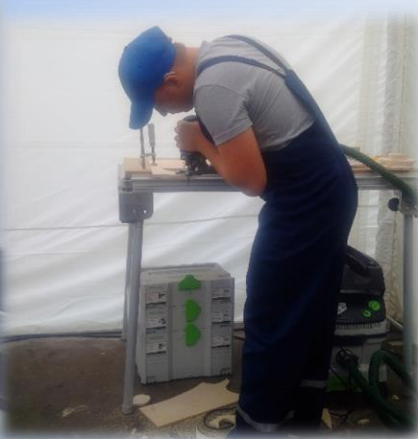
ООО «ЭВАЛЬД МЕБЕЛЬ»