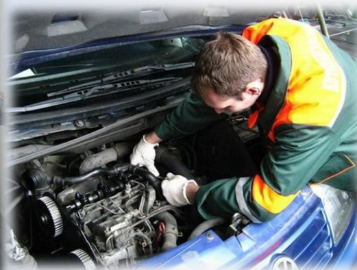
ООО «ГОЛДЕН АВТО»