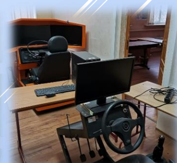
ТРЕНАЖЕР ПО ВОЖДЕНИЮ АВТОМОБИЛЯ